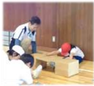
3年生体力テスト ボランティア